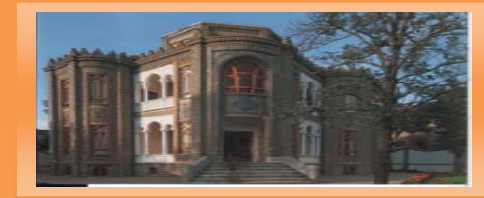
موزه نقاشی پشت شیشه _ کوشک شقاقی